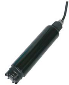
[ Optical DO 센서 : MD1900 ]